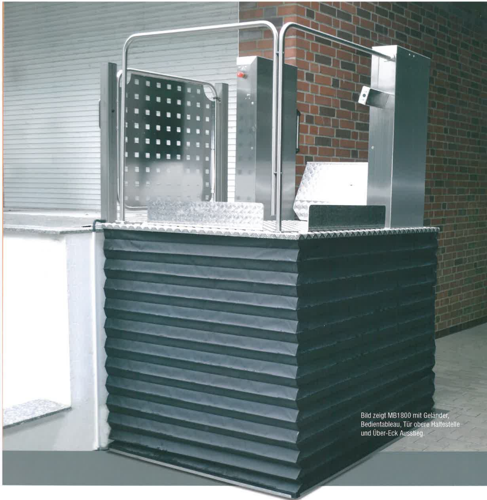
Bild zeigt MB1800 mit Geländer, Bedientableau, Tür obere Haltestelle und Über-Eck Ausstieg.

Die Auffahrrampe ist zeitgleich die Abrollsicherung für den Rollstuhlfahrer